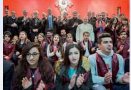
Rencontre des Evêques avec des réfugiés

«Si avec ma famille je voulais rester sur notre terre, l'Irak, nous avons deux solutions: nous convertir à l'Islam ou être tués... De nuit, nous avons tout quitté! Nous voulons rester fidèles à notre Foi au Christ et à l'Eglise!». «Maintenant, ici en Jordanie, nous sommes des mendiants mais nous avons gardé la Foi!».