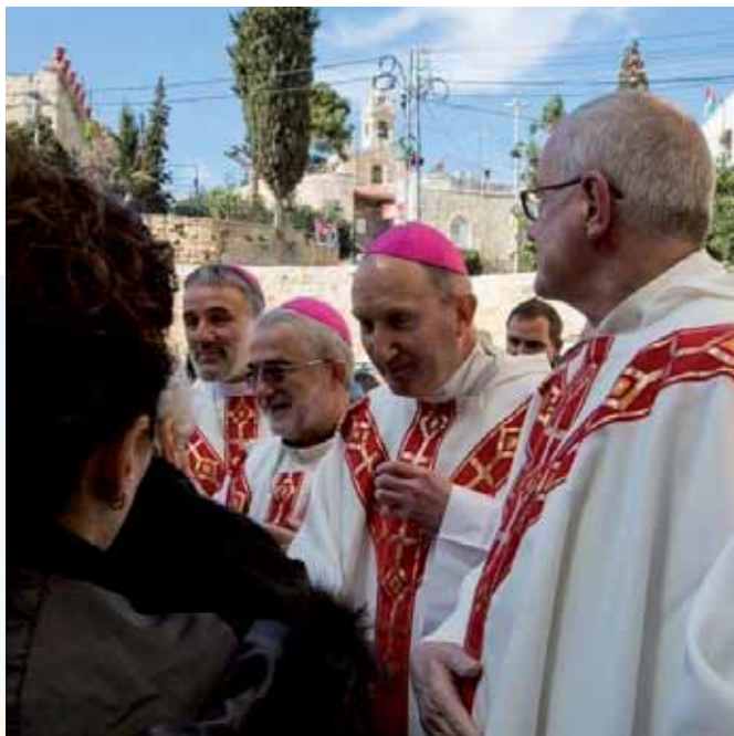
Mgr Pierre Bürcher en Terre Sainte