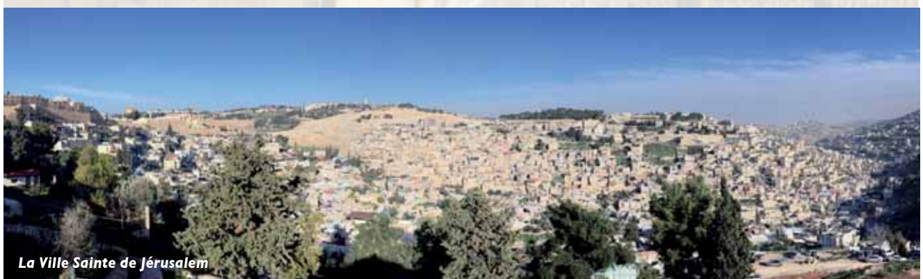
La Ville Sainte de Jérusalem

Si vous souhaitez des renseignements, n'hésitez surtout pas à nous contacter à l'adresse suivante: Association Saint Jean-Marie Vianney Lausanne, CH-1018 Lausanne.